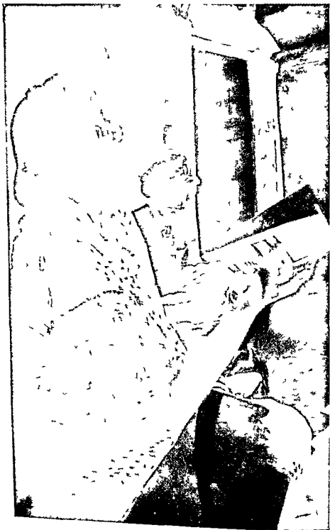
महार्जुन भात्र मन्डिर न महत्त व साय वार्तालाप वरतो हई सम्पादिका ।