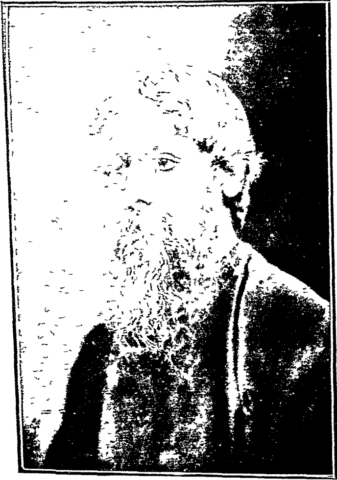
महाकवि सर रवीन्द्रनाथ ठाकुर